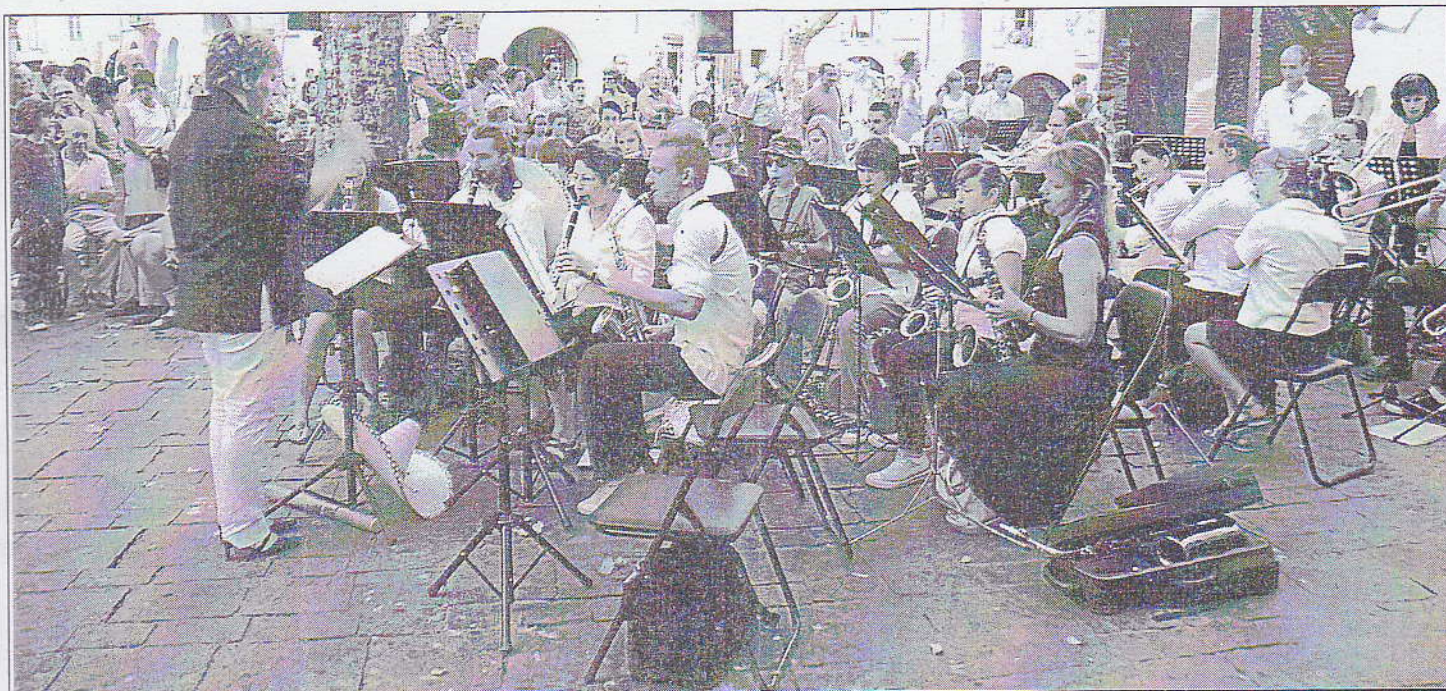
L'orchestre de l'école municipale de musique a interprété des musiques du monde qui étaient une invitation au voyage.

Le 25 e anniversaire du jumelage Uzès-Schriesheim a été marqué vendredi dernier par une large ouverture vers la population. Une forte délégation de 93 allemands avec à sa tête son bourgmestre M. Hofer et son préfet, le Docteur Schutz, a été dans un premier temps invitée à un banquet de 150 convives, dans la salle polyvalente, au cours duquel eurent lieu les premiers cadeaux.